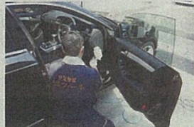
高級輸入車「アウディ」へのセルフィール施工現場

繊維分野では、「空気触媒 TioTio」（サンワード商会の商標）として学生服やスポーツウエア、ジーンズのほか、帽子、ハンカチ、ランニングシューズ、航空機のシート、寝装具、ユニホーム、学