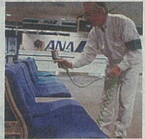
新千歳空港にも施工されている

もちろんマンションや戸建て住宅にもすでに多くの実績がある。最近では新築マンション販売のオプション施工としても増え、認知度は高まっている。