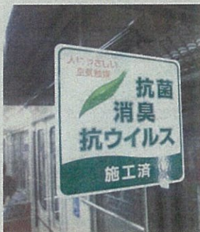
大阪市営地下鉄の窓に張られたセルフィール施工済みステッカー

公共交通機関で初めて「セルフィール」を採用したのは、大阪市交通局の通称「赤バス」。窓が開閉できず、においがこもる構造で乗客からのクレームが相