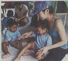
NPO法人タッチンピースによるカンボジアHIV感染孤児の支援活動

一方、NPO法人タッチンピースでは、プロのセラピストによる手のひらセラピー(治療)活動を、広島原爆養護ホームやカンボジアHIV(ヒト免疫不全ウイルス)感染孤児施設などで行っている。